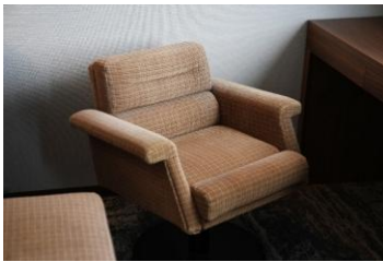
②A個室寝台「ロイヤル」の チェア