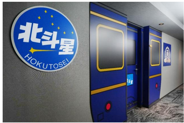
「北斗星コレクションルーム」入口ドア

本コレクションルームは、1988年（昭和63年）3月から27年間、上野～札幌間を結ぶ寝台特急として多くの鉄道ファンに愛された「北斗星」をテーマにした客室です。多様な個室寝台や食堂車を連結した豪華寝台特急として運行した「北斗星」。今回、新設する『北斗星コレクションルーム』は、その貴重な鉄道部品の数々をインテリアとして使用し、「北斗星」の動画や同列車で実際に使用していた浴衣（復刻版）を用意するなど、往時の鉄道車両の魅力を1室に詰め込んだこだわりの空間です。