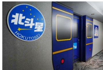
①客室入口に「北斗星」の ヘッドマーク・エンブレム