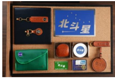
⑥当時車内で販売されていたエンブレム キーホルダーの複製品等を収めた 「北斗星コレクションケース」