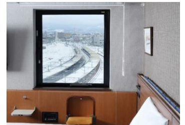
⑧トレインビューを楽しめる 位置に折り畳みいすとミニ テーブル