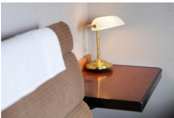
②A個室寝台「ロイヤル」の ソファベッド、 食堂車「グランシャリオ」の テーブル照明