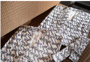
③実際に使用されていた 浴衣（複製版）を貸与