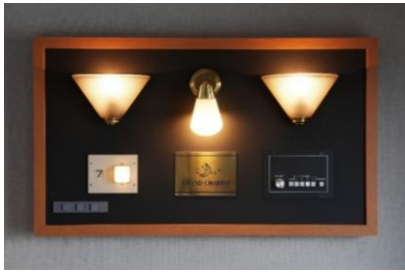
④各車両で使用されていた備品を 1つのパネルに集めた 「北斗星コレクションボード」