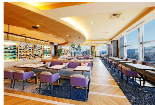
レストラン&amp;バー「SKY J」内観