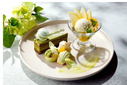
フレッシュグリーンパレット