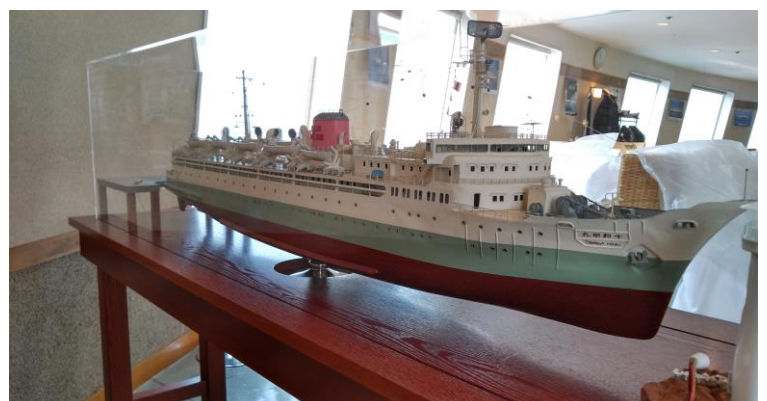
青函連絡船「十和田丸(初代)」