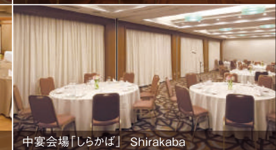
中宴会場「しらかば」 Shirakaba