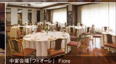
中宴会場「フィオーレ」 Fiore