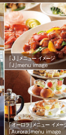
「J」メニュー イメージ 「J」menu image