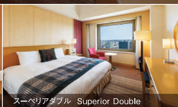
スーペリアダブル Superior Double