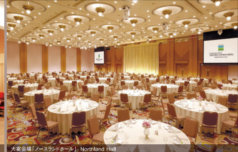
大宴会場「ノースランドホール」 Northland Hall