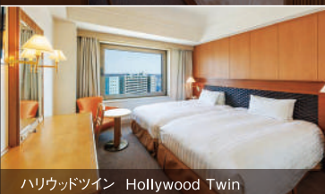
ハリウッドツイン Hollywood Twin