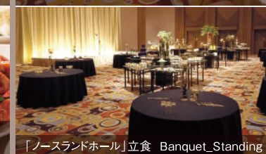
「ノースランドホール」立食 Banquet_Standing