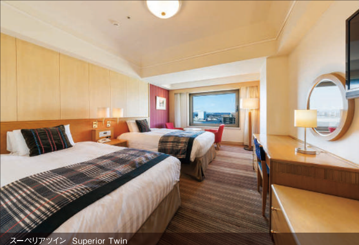
スーペリアツイン Superior Twin