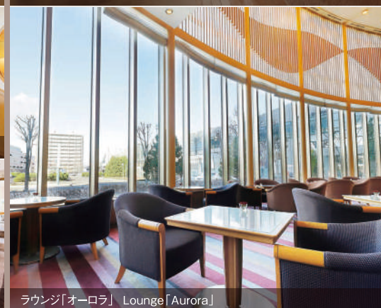
ラウンジ「オーロラ」 Lounge「Aurora」