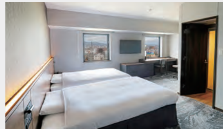
ラージツインルーム 30㎡