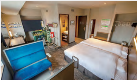
キハ40トレインルーム 30㎡