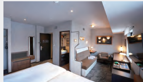
北斗星コレクションルーム 30㎡