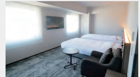
ユニバーサルルーム 31㎡