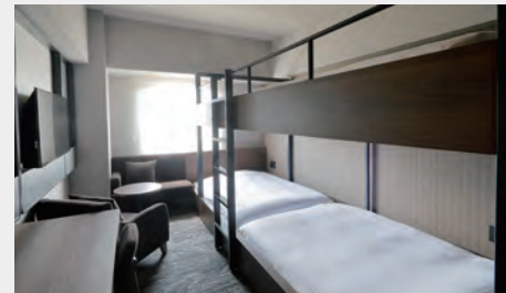
コンセプトルーム 20㎡