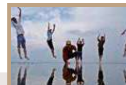
社員旅行で行ったマレーシアの「天空の鏡」。海外でたくさんの刺激を受けました。

ホテルの仕事は、チームワークが命。JR北海道ホテルズはどの部署もチームワークが良く、のびのびと働けます！