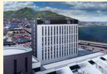
JRイン函館 函館市若松町12番14号 TEL:0138-22-2333 客室数:215室