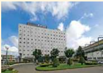
JRイン千歳 千歳市末広6丁目4番4号 TEL:0123-25-8357 客室数:185室