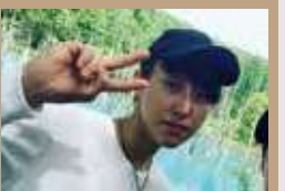
休日は、仲の良い友人と出かけます。これは美瑛の青い池に行った時のものです。

ホテルの調理は、様々な料理を手がけるため幅広い技術が身に付きます。先輩方の丁寧な教え方も相まって成長できる環境です。